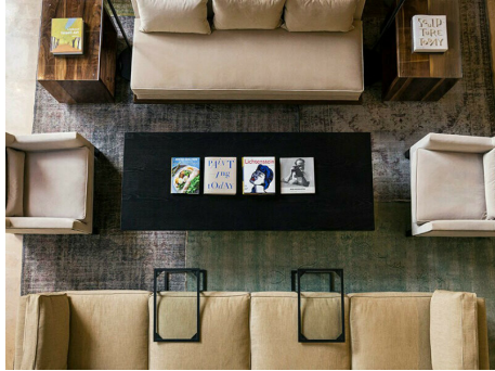
Snacks am Nachmittag in der Lounge.